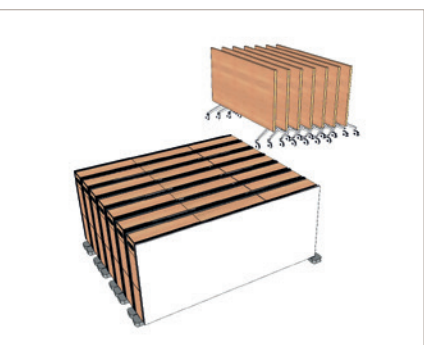
Rangement compact / Compact storage

Dimensions: Modules L:160 X l:20 X ht:72cm / Tables L:160 X l:64 X ht:72cm